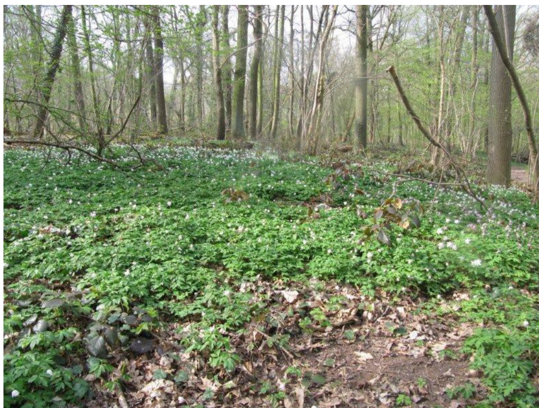
Een wit tapijt bosanemoon